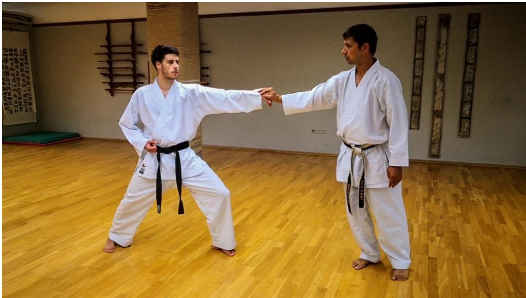
Slika 1: Provjera ispravnog poravnanja u položaju oi - zuki.