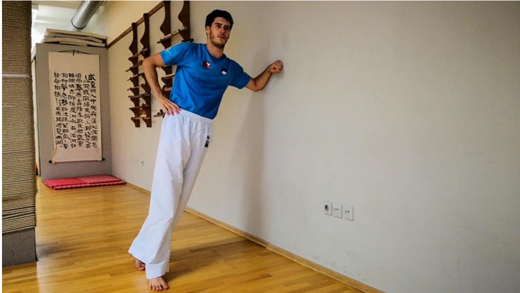
Slika 4: Bočno oslanjanje na zid