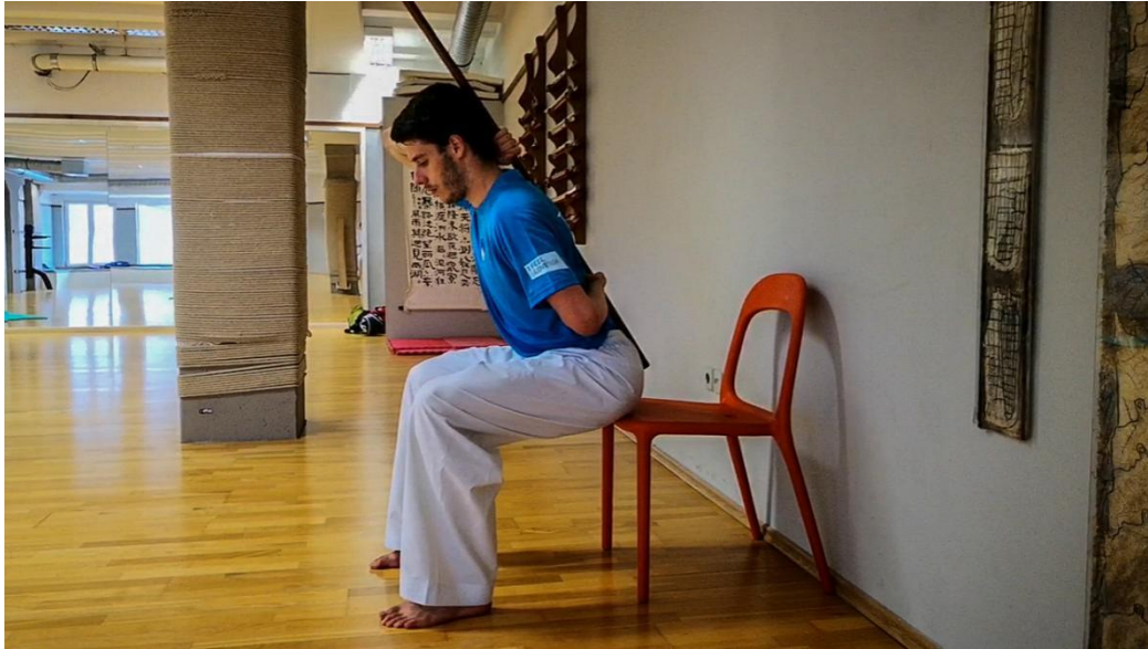
Slika 5: Prvi koraci do stola