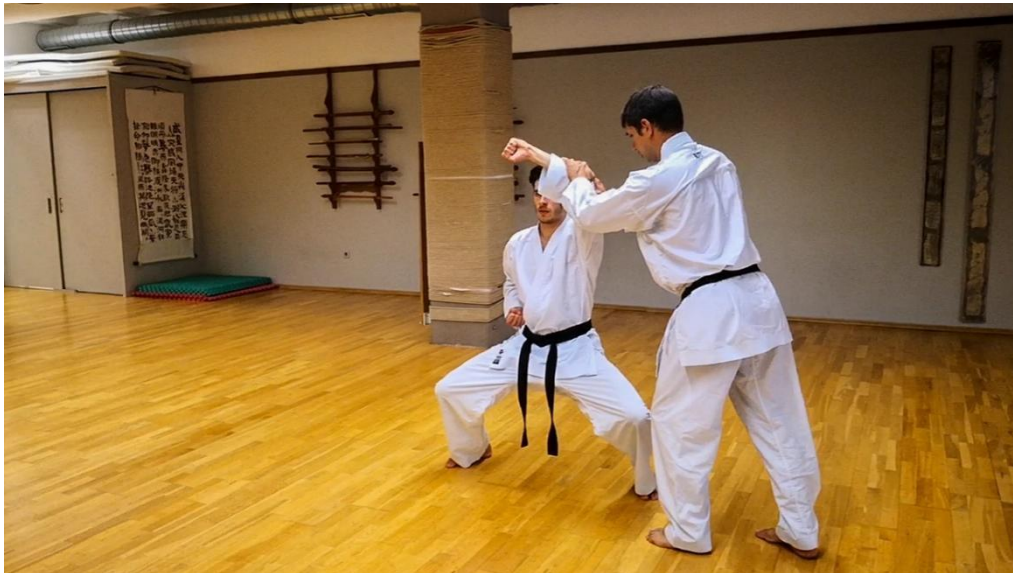
Slika 3: Provjera ispravnog poravnanja u položaju age uke.

Video materijal prikazuje neke od ispravnih provjera poravnanja. Pravilnim usklađivanjem ne odupiremo se vanjskim silama s mišićima, već pravilnim postavljanjem kostura. Mišići samo održavaju kostur u ispravnom položaju. U slučaju pravilnog poravnanja, tijelo vježbača, kada se pritisne, ne oscilira ili se savija, već održava poravnanje.